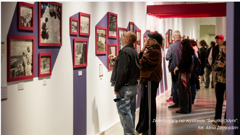
Zwiedzający na wystawie "Światło Gdyni".